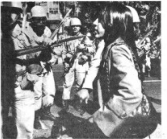
نیسارهای "ارتش اسلامی" میخواستند بکار دیگر سربازان را اجزوم جدا کرده و روزی آنان قرار دهند .

با ستون دوباره در مبارزات هسا همان سرباز قدسی را که مجبور بود برده وار