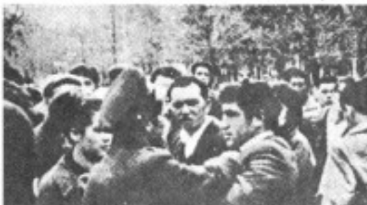
صحنه‌ای از تظاهرات تاتارها برای بازگشت به سرزمین اجدادی خود

اجازت بازگشت به کریمه داده نشد و تعدی و جنایات زبان استالین علیه آنان ادامه یافت. تاتارهای کریمه باحال مبعوضات از خواست‌های آنان پاسخ داده نشده است. در پایان نامه فوق‌الذکر به کنگره حزب کمونیست در سال ۱۹۶۱ تاتارهای کریمه‌ای ۵ خواست زیر را مطرح کردند: ۱- اجازه دهید که تاتارهای کریمه‌ای بطور سازمان یافته به سرزمین اصلی خود کریمه بازگردند و شرایط را برای گسترش و توسعهٔ فرهنگ آنان خلق، بمحافل یک ملت همبسته سازند. ۲- یکبار دیگر فرمان حرج ۱۸ اکتبر ۱۹۴۱ لغت شده و تاتارهای کریمه‌ای به سرزمین خود بازگردند. ۳- سرحدات جدید که کنگره کمونیست را که بخاطر شرکت در جنگ در جبهه شرقی، از حزب اخراج شده‌اند به آنان بازگردانند. ۴- نمایندگانی که با آنها بخاطر شرکت در جنگ جبهه شرقی، محکوم شده‌اند، عفو و آزاد گردانند. ۵- افرادی را که به جرم ارتخ خلق تاتار کریمه دست زده‌اند، مجازات نمایند. ۶- پاسخ حاکمان اتحاد شوروی به این درخواست‌ها با بحال از دست و آزار و اذیت است. چه آنان که تاتارهای کریمه بوده‌اند، چه کسانی که تاتارهای کریمه را محکوم کرده‌اند.