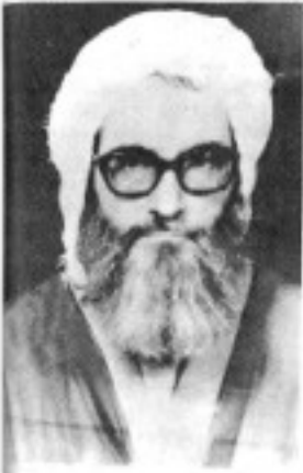
شیخ عزالدین بن حسینی

روز ۲۶ خرداد مقرر شده و حضور افراد ارشد و مجری به ختم کنفرانس نمایشی خود شده اند. برای خالی نمودن مریخه قطعنامه‌ای نیز تصویب کرده است که از تصمیم خود آگاه مردم شکست کرده بعضی آگاهان کاین قطعنامه به ضلالت اجزا دارد. بنابراین در راه مبارزات - در این قطعنامه آمده است که "ما باید گامی به کنفرانس بعدی یا شرکت همه نیروها باشد. انتقاد شوند با بشورت انتقاد شخصی خرسه و نقیب و بعضی برای خود مختصا را کرده شان تهیه نمایند و با تعدادگان دیگری به سمت عقول انتقاد خواهند شد تا با گذشتن طرح از تصویب نمایند." ( نقل از آیندهگان ۲۶ خرداد ) واقعاً مقرر شده و دولت مرکزی سیاست خود را تغییر نداده اند - جلوگیری از انتقادات آزاد و همی - جلوگیری از حس تعیین سرنوشت همه های آژانس علی خواست های بعضی ملت کرد - اما شکست کنفرانس ۲۰ خرداد شکست سیاست ارجیانی مقرر شده و روشن نمود .