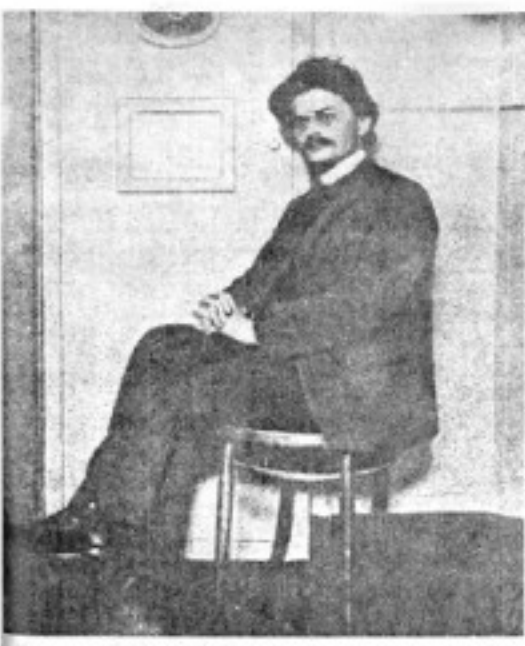
تئودور که در سلول زندان قبل از محاکمه وی در سال ۱۱۰۶

آوردن تاریخ آن بود - بلکه دشمنان مسلک در اینجا بارها شیده باید که در کابین و نوامیر کارگران خود را بر طبقه جمعیت مدینه باور می کردند - اگر انسان از آنچه گسسته در سطح این دادگاه - در جریان آمد هیچ چیز نمی آید - برای این مطلب کارل فریدلبرگ درک بود که چگونه - در یک کشور انقلابی - جایی که اکثریت جمعیت از اربابان آزادی صاحب می شدند - جایی که نبوده های شکست پیروز نشان می دهند - چگونه در چنین کشوری - مدعا و هزاران کارگر قادرند خود را بسازی مبارزه با جمعیت مدینه که پیش گویاست و با همین آزادی و تشکیل مردم مسلح سازند - آیا این ملودین جامعه - ایمن کلمات - موفقیته اجتماعیان هر چه نبوده ها باشد - خیلی خطرناک است - خیر - البته گسسته خطرناک نیستند - اگر فقط گروه های وقت - آفرین چون جمعیت مدینه بر سر راه مردم ایستاده بودند - مشکل بسیار کوچکی وجود داشت - ولی ما به تنها از سازمان خود متحذران که بعنوان شاهد در اینجا حضور یافتند - بلکه کارگرانی هم که در اینجا شهادت دادند شیده بود - جمعیت مدینه - اگر نگوییم "پوکین" همه - ولی پوکین همه از برای از سلطان دولتی حمایت می نمود - شیده بود که در پشت سر این گروه - های چپای مدستان که هیچ چیز بسیاری از مدینه اند - در اندام و هیچ چیز - نه نوبهای خاکشتری باقی ببرد - و نه با تک بی دفاع و نه با چه مانع آنها نمی شود - مساسگران دولتی ایستاده اند که بدون شک جمعیت مدینه را از بدو جدا و دولت سازمان می دهند و مسلح می سازند -