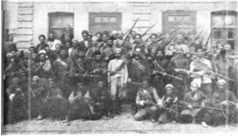
در ایران زمینستان نیز جنایات خود را برای دموکراسی با ایجاد انجمن‌ها در انقلاب شوریه آغاز کردند -

در جایی دیگر طبری در باب محسوس دموکراسی ایرایش در اتحاد شوروی می‌دهد - تلف می‌کند "شکل پارادایمی و مستقیم - حقیقت‌داری در جوامع سرمایه‌داری به هیچ وجه شاک طیف دموکراسی و دموکراسی حقیقی نیست - انقلاب سوسیالیستی اکثر شکل‌های یعنی شکل شوروی - دموکراسی را بدیده آورد است که در دنیا اولین نفر را مستقلاً در کت دانش و اداره" بی‌وزنت جامعه - می‌دهد - اصل در دموکراسی سوسیالیستی همین شرکت بوده‌ها طبری می‌نویسد - کالا مستقیم و همه‌جانبه کشور و جانشین کردن دموکراسی مستقیم برای دموکراسی مستقیم است - آنگاه با کالا همین است که انقلاب سوسیالیسم اکثر شکل تئور دموکراسی، دموکراسی غیر ها را بوجود آورد - مثلاً این شکل چه